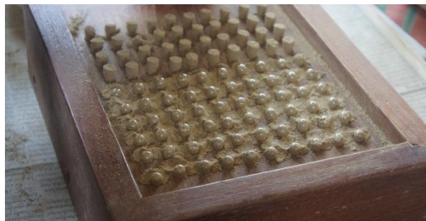
10. ผู้บันทึกข้อมูล นายจักรพันธ์ ม่วงคราม วันที่ 15 ธันวาคม 2557